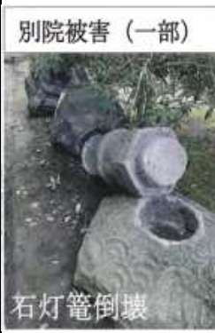
別院被害(一部) 石灯笼倒壊

昨年十一月の報恩講に合わせ護持会費(門徒会費)の納入が始まりました。市内ご門徒や有縁の皆様には十一月中旬に、お世話人より納入袋を配布いたしました。また、市外ご門徒の皆様には、振込用紙をお届けいたしました。既に多くの皆様にご進納を賜りましたこと、厚く御礼申し上げます。ご進納済の皆様には、お扱いの品をお世話人、または郵送いたしております。振込進納の皆様には、振込確認後の発送作業となります関係から、お手元にお届けするのに時間を要しております。今暫くお待ちください。市内、ご門徒でお扱いをお受け取りでない方はお申し出ください。尚、ご進納期限は本年度は三月末日となっております。ご門徒の皆様には、物価高騰による出費多端の折柄、まことに迷惑をおかけすることになります。何卒ご理解を賜りご協力いただきたくお願い申し上げます。 ■令和六年能登半島地震 金沢別院より「復興支援御礼のこと」 令和六年能登半島地震発災直後より、全国より物心両面にわたってご支援を賜っておりますこと有り難く、心より厚く御礼申し上げます。石川教区教務所にてお預かりしております御見舞金や義援金、支援金等につきましては、石川教区災害対策委員会の協議をふまえ、教区内の被災されましたご寺院様へお届けさせていただきます。本願寺金沢別院へのご支援につきましては、別院内被災箇所修復経費に充当させていただきます。別院内支援センターへお送りくださる支援物資につきましては、現地の需要に応じて順次搬送しております。引き続きのご支援を賜りますよう、何卒宜しくお願い申し上げます。