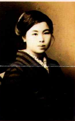
金子みすゞ 本名金子テル

明治36(1903)年、山口県大津郡仙崎村(今の長門市)に生まれる。大正末期から昭和の初期にかけて、すぐれた童謡詩を発表し、西條八十に「若き童謡詩人の中の巨星」とまで称賛されながら、昭和5(1930)年、26歳の若さでこの世を去った。童謡詩人・矢崎節夫の長年の努力によって512編の遺稿がみづかり、没後50余年を経て、全集として出版された。平成15(2003)年4月には、みすゞ生誕100年を記念して、ふるさと長門市に「金子みすゞ記念館」が開館。全国からみすゞファンが訪れ、感動を新たにしている。