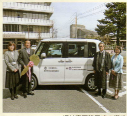
福祉車両贈呈式の模様